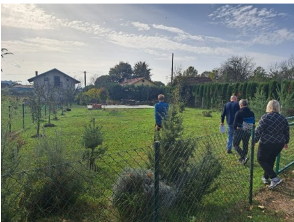
De locatie voor het gebouw