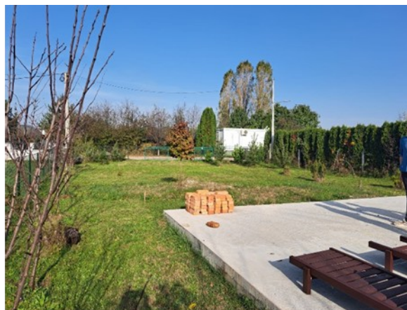
De fundering is reeds gelegd en wordt mogelijk nog uitgebreid