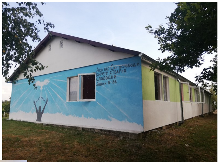
De kliniek met op de muur de Bijbeltekst Johannes 8 v. 36: “Pas als de zoon jullie heeft vrijgemaakt zullen jullie werkelijk vrij zijn”

De kwaliteit van de foto's laat wat te wensen over maar hierbij toch een impressie van de nieuw douchecabines en wastafels.