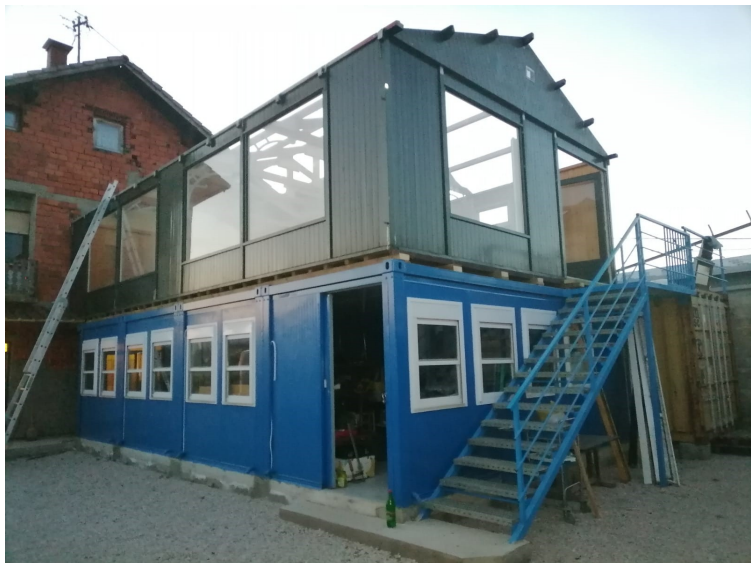
De groene prefab unit is nieuw aangebouwd

Dit jaar is de "Hativka" uitgebreid met een door onze stichting geleverde houten prefab unit. De ruimte zal dienstdoen als showroom en/of extra opslagruimte. De toestroom van goederen is door de jaren heen telkens toegenomen, waardoor de winkel nog steeds een groot aanbod koopwaren heeft.