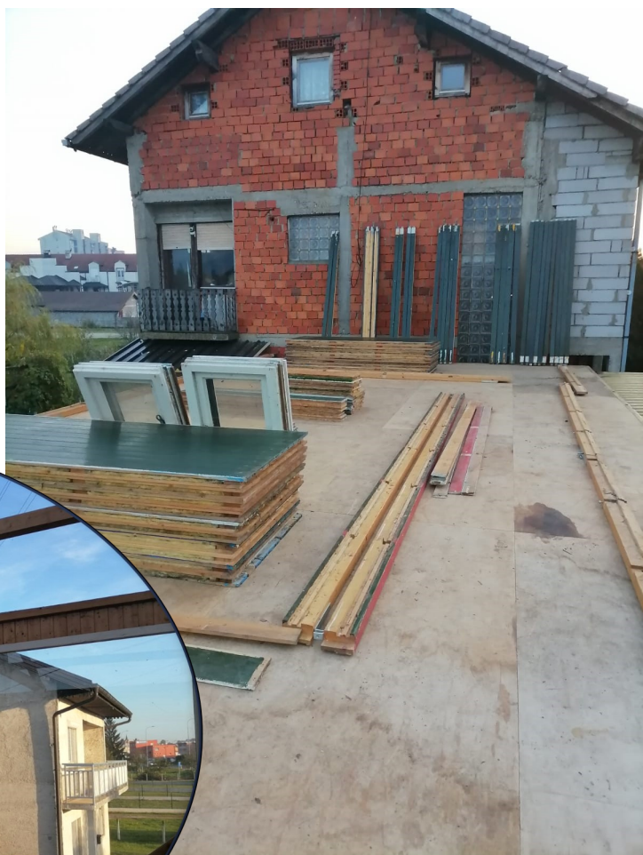
Aanleg van de fundering voor extra opslagruimte